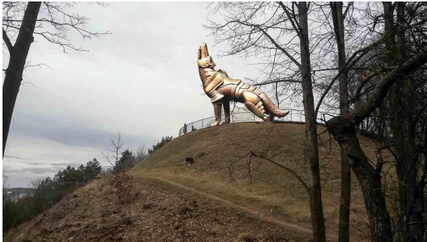
The Howling Iron Wolf

BUT I LIKE VILNIUS MOST. IT IS 700 YEARS OLD. I WANT TO TELL YOU THE LEGEND ABOUT THE FOUNDATION OF VILNIUS.