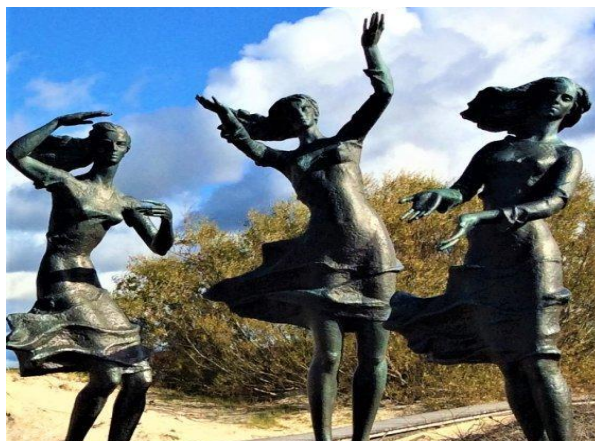
“Fisherman’s Daughters” in Šventoji