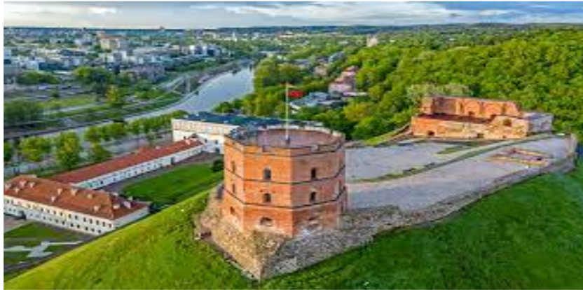
Gedimino Tower in Vilnius