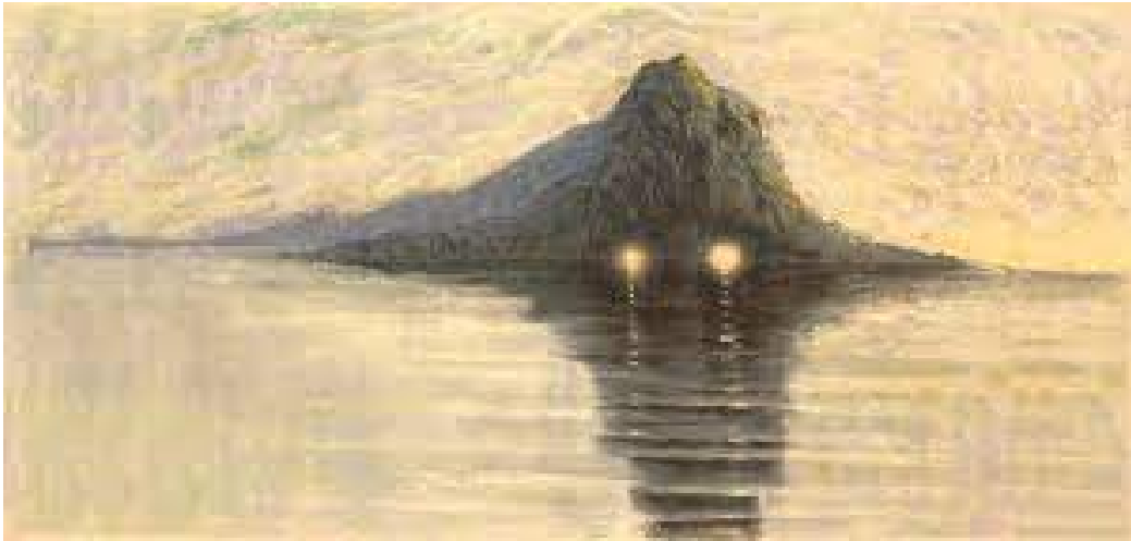
Serenity (1903) by M.K. Čiurlionis