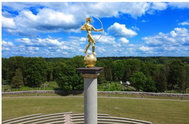
The Sun Clock Square in Šiauliai