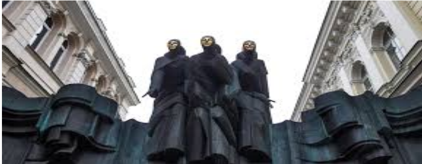
Lithuanian National Drama Theatre

MUMS REIKIA ŠIŲ VEIKĖJŲ. PRAŠAU PASIRINKITE VARDA, PAVARDE IR PROFESIJĄ: