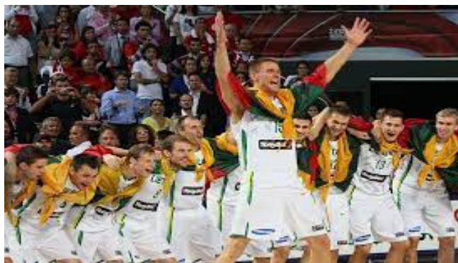
Lithuanian National Basketball Team

AŠ LABAI DŽIAUGIUOSI, KAD SUTIKAU TAVE ASMENIŠKAI!