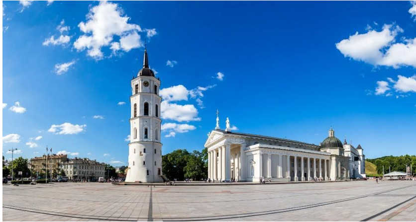
The Cathedral Square in Vilnius