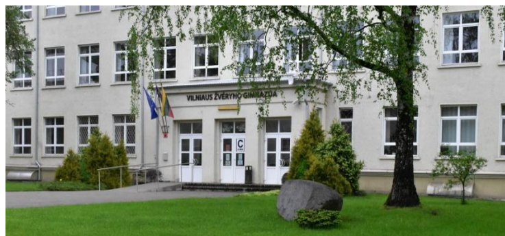
Vilniaus Žvėryno Gymnasium