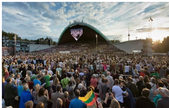
The Song Celebration